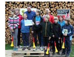
Die Sieger im Team-Wettbewerb 2012