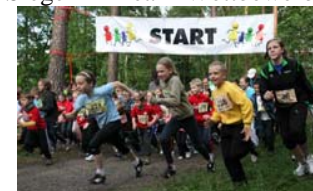
Der Start zur „Grünauer Meile“ 2012